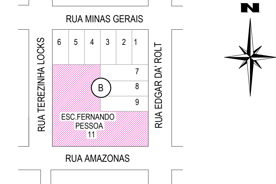
SITUAÇÃO Escala: 1/2000